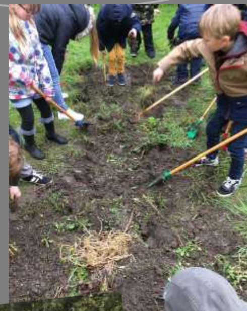
Désherbage, semis, plantations