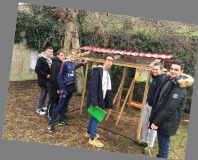
La mise en place.