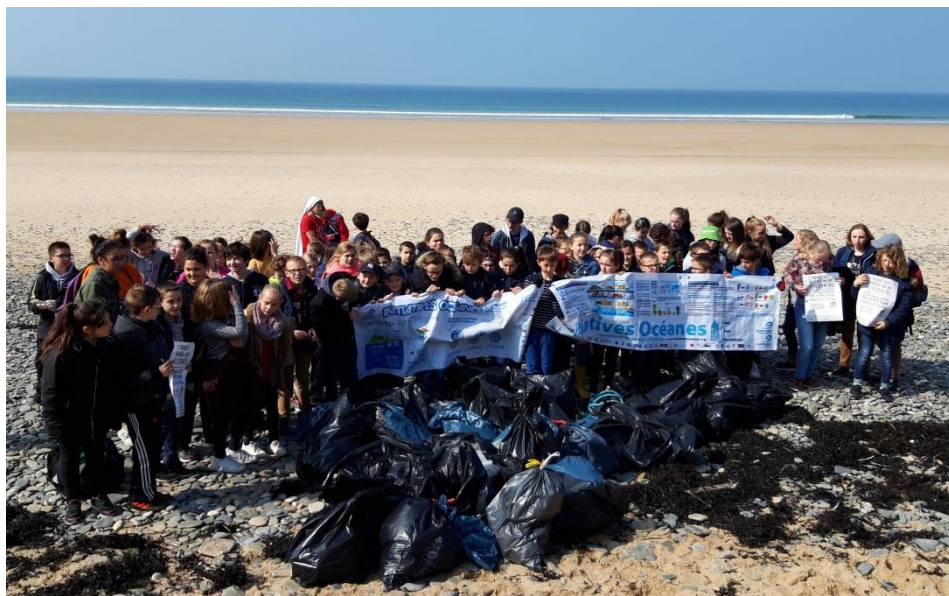
Le cycle 3 de l'école et du collège