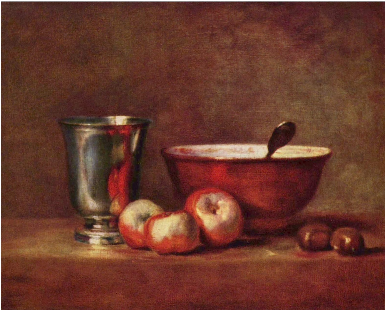
Nature morte au gobelet d'argent, Jean Siméon Chardin

A l'occasion d'une visite au musée, pensez à regarder les natures mortes !