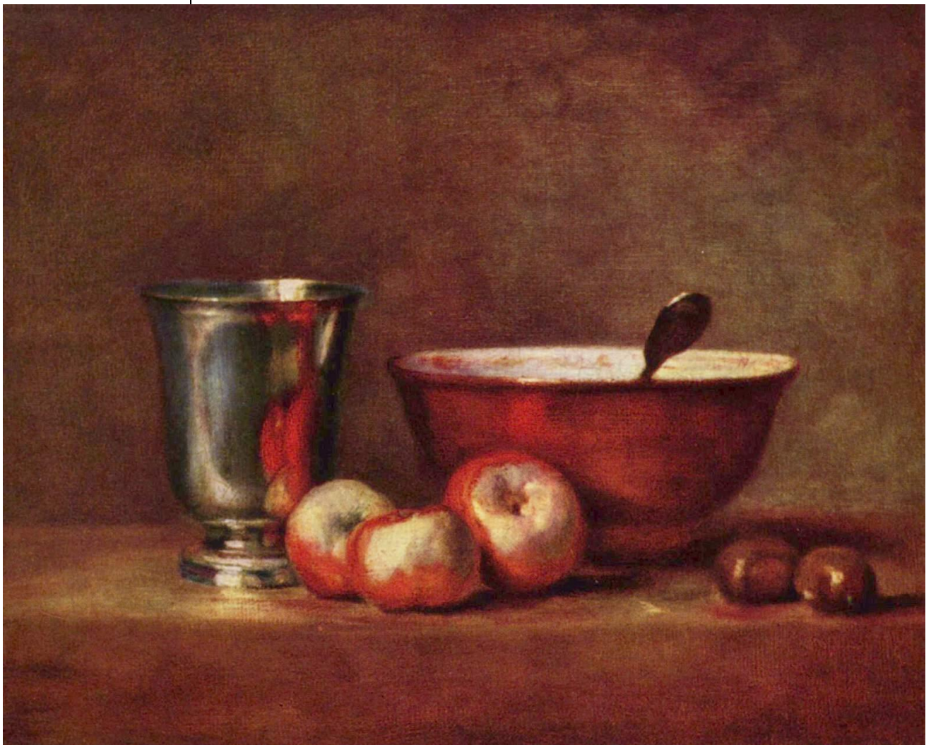
Nature morte au gobelet d'argent, Jean Siméon Chardin

A l'occasion d'une visite au musée, pensez à regarder les natures mortes !