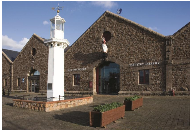
L'intérieur et l'extérieur du musée maritime