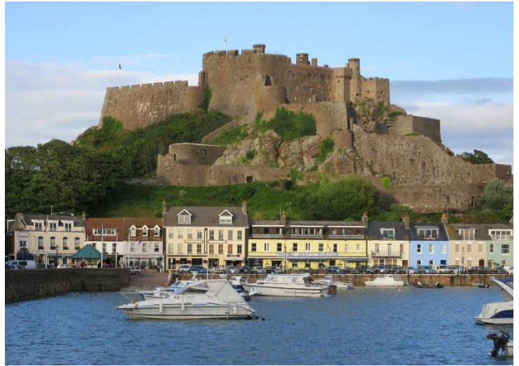
Château de Montorgueil, Jersey

L'île est un mélange de réserve anglaise et de savoir-faire français qui abrite un port cosmopolite et des vallées secrètes intemporelles pour une combinaison unique d'élégance continentale et de paysages rassurant de familiarité. Ses attractions variées et sa beauté naturelle font de Jersey la destination idéale pour des vacances ludiques et éducatives, ou pour un voyage scolaire.