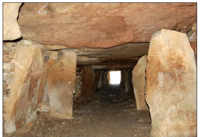
Le passage de la Hougue Bie