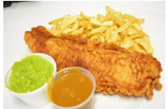
Le classique incontournable culinaire, le Fish and Chips !