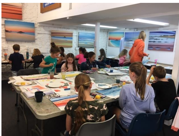
Atelier peinture à la Harbour Gallery