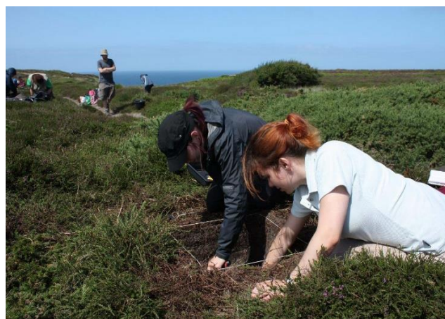
Le site du Canal de Squez