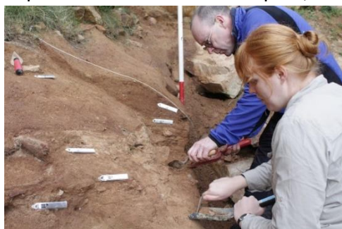
Le site de la Cotte de St.Brelade

Ces dépôts contiennent des centaines de milliers d'outils en pierre de Néanderthal, ainsi que des restes de leurs proies animales. Au cours des 190 000 années où l'homme de Néanderthal utilisait la Cotte, le paysage environnant changeait considérablement. Durant les périodes de chaleur, Jersey a sûrement été une île, comme aujourd'hui, mais pendant les périodes de grand froid, La Cotte dominait une terre sèche - une plaine ouverte disséquée, avec la « Manche moderne » rétrécie à l'époque en une rivière profonde et au courant rapide, au loin.