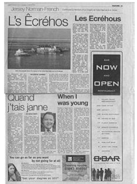
Jersey Evening post, le journal local contenant une page en Jerriais