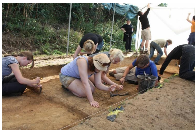
Le site des Varines

Les chemins traversant la bruyère des hautes terres sont boisés d'outils en pierre érodés d'un campement occupé il y a environ 9 000 ans ; ici, les gens apportent des cailloux en érable et produisent de minuscules lames et des outils (« microlithes »), qui ont été conçus comme des pointes de lances légères ou de flèches. À ce stade, le niveau de la mer était encore bas et les zones maintenant sous la mer auraient été des terres très productives aujourd'hui. Les falaises au nord de Jersey semblent avoir été un endroit privilégié pour les chasseurs mésolithiques ; ils auraient fait face à la mer, leurs habitats surplombant une large plaine côtière. À cette époque, le niveau de la mer augmentait à mesure que le climat se réchauffait, créant de nouveaux paysages d'îles et de péninsules.