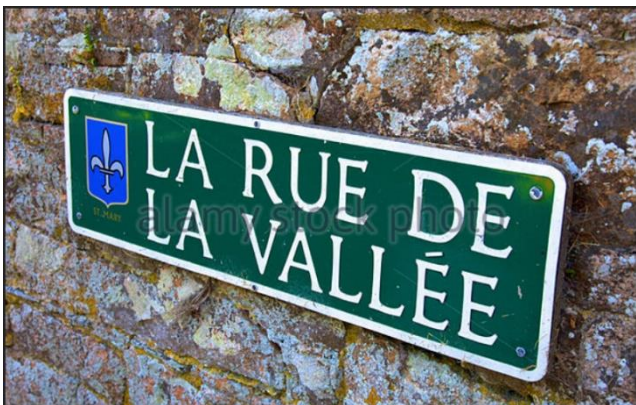
Les rues de Jersey portant un nom français