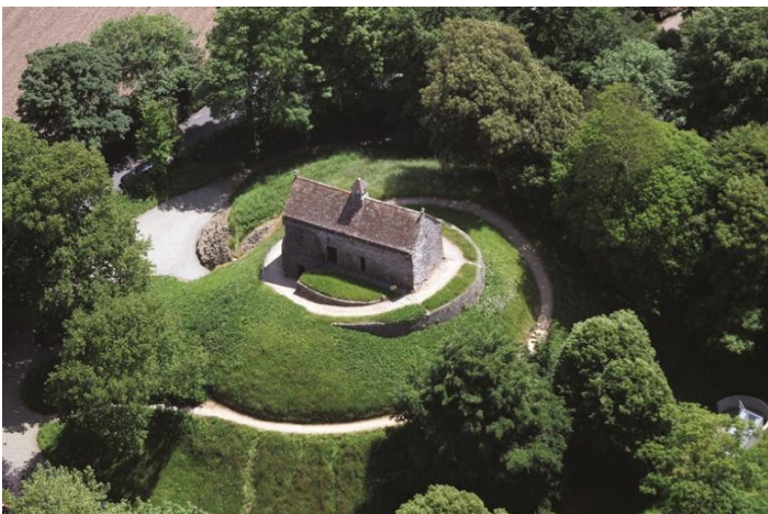
Le musée de la Hougue Bie