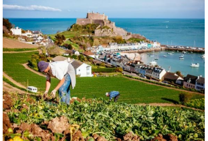
Ferme de pommes de terre à Jersey