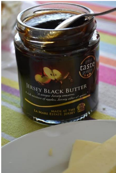
Jersey Black Butter